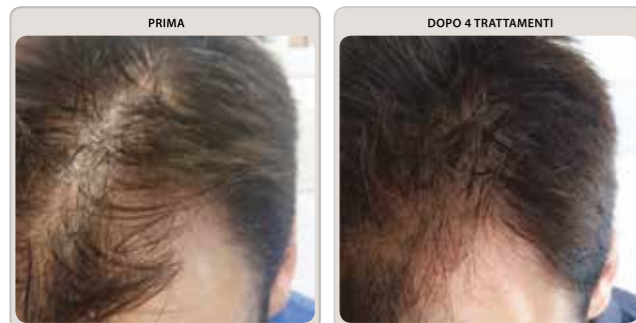
Uomo, 25 anni