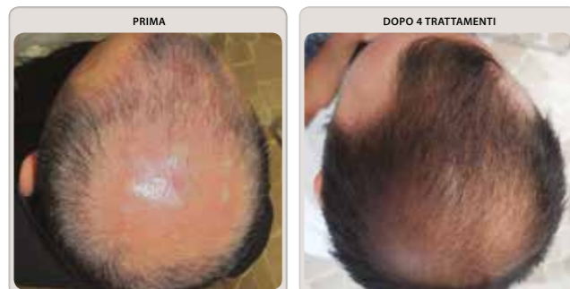
Courtesy of Dott. Riccardo Lazzari - Cinisello Balsamo (MI) - Uomo, 30 anni