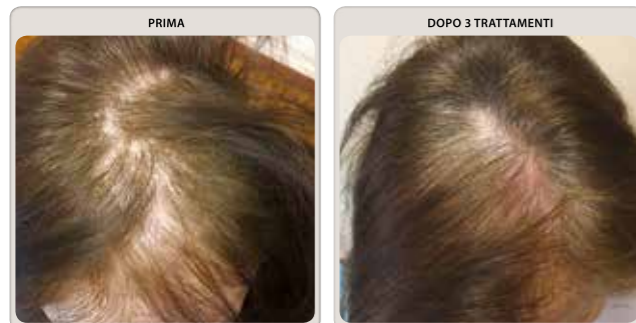
Donna, 55 anni