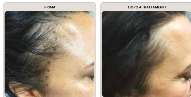
Donna, 45 anni

Seventy BG è una società che sviluppa cosmeceutici e prodotti professionali innovativi nell'ambito della medicina estetica .