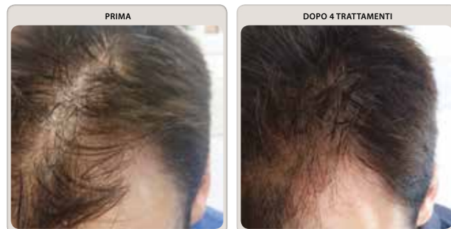
Uomo, 25 anni